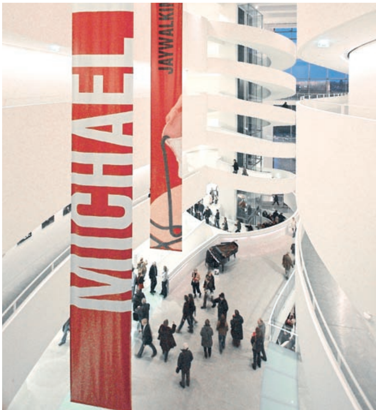
ARoS Aarhus Kunstmuseum – et internationalt billed- og oplevelseshus. Udstilling Michael Kvium – Jaywalking Eyes, 2006.