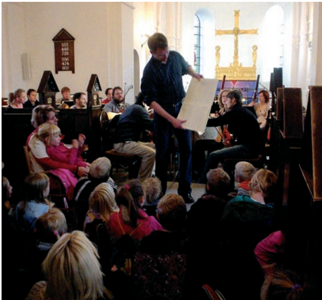
Den Jyske Sinfonietta, Det store formidlingsprojekt 2004-2006. Åben orkesterprøve for børn på Haydns storværk "Skabelsen".