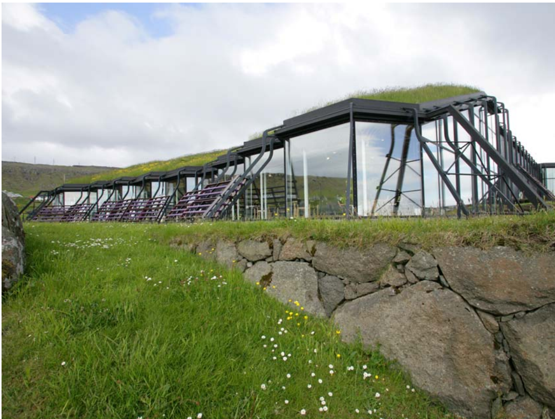
Nordens Hus på Færøerne

Kulturen er en grundlæggende fællesnævner for Norden og derfor vigtig i den internationale branding af Norden. For at styrke mulighederne for at anvende kultur til branding vil formandskabet arbejde for økonomisk fokusering på særlige indsatser og fællesnordiske kulturfremstød. Nye muligheder for bedre koordineret netværkssamarbejde imellem nationale, nordiske kulturinstitutioner, råd og nævn vil blive undersøgt. Konkret vil der blive gennemført initiativer, der sætter nordisk kultur og nordiske kulturprodukter på verdenskortet, eksempelvis inden for globaliseringssatninger ”Kultur og Kreativitet”.