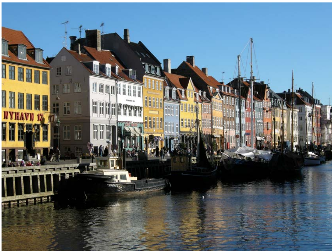
Nyhavn i København - Danmark