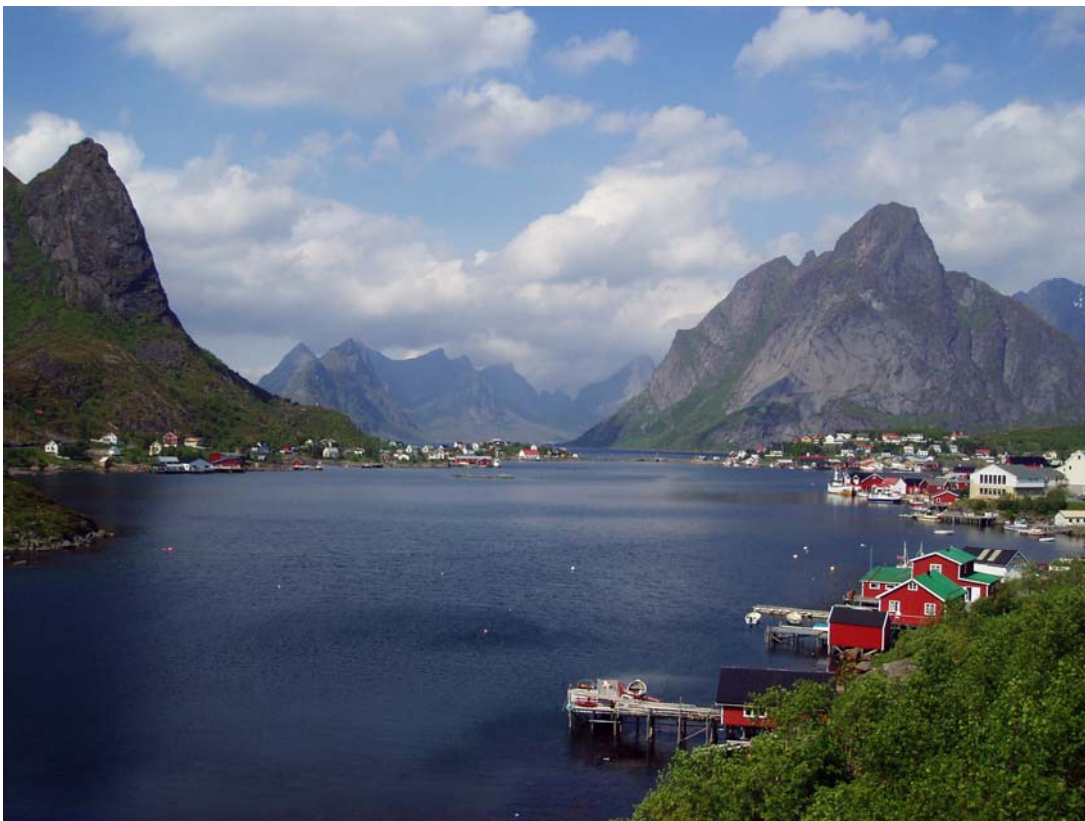
Lofoten - Norge

Dette er spørgsmål, som ikke alene vedrører det arktiske område, men vil blive en global udfordring i de kommende år. Norden kan måske bidrage til en bedre og bredere forståelse for problemerne og de udfordringer, samfundet står over for, ved en indsats, der er specifik i forhold til det arktiske område, men generelt i forhold til verden.