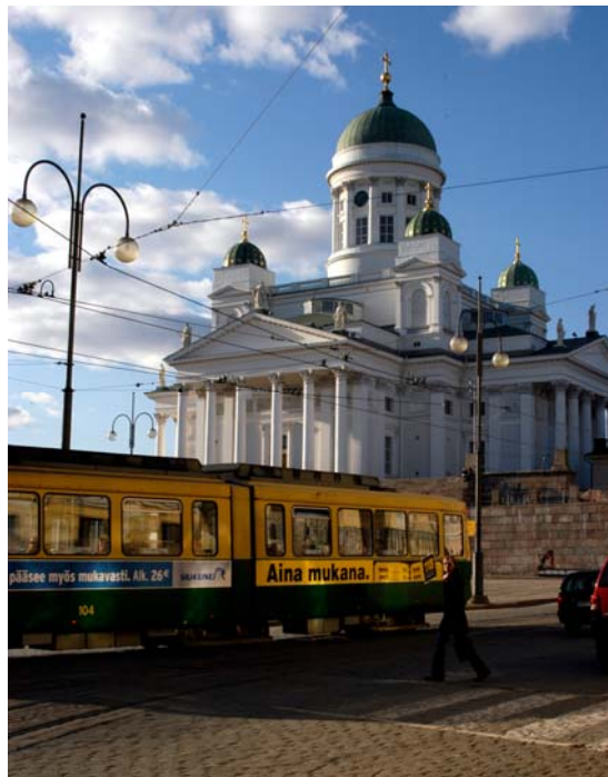
Sporvogn - Finland