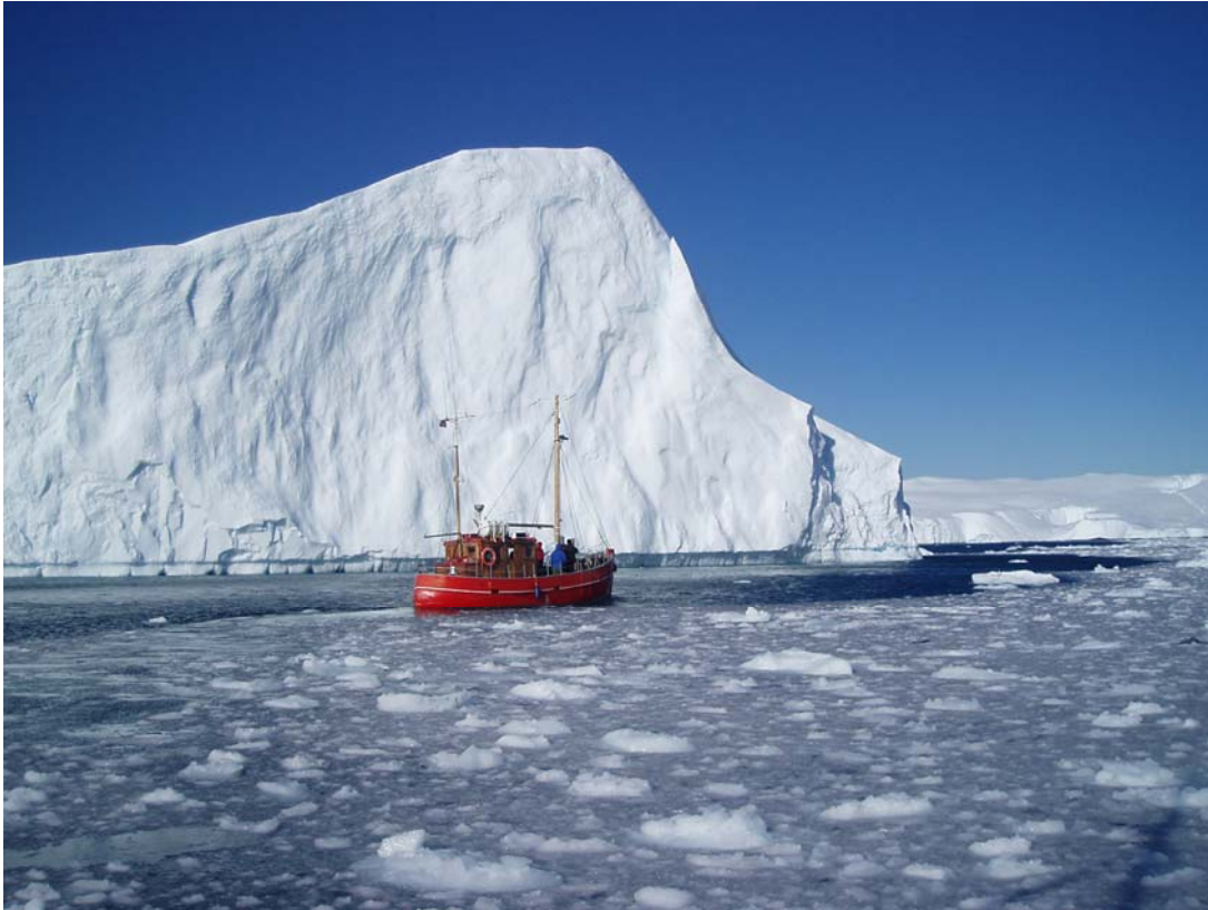
Båd og isfjeld – Grønland

Placeringen af konferencen/workshoppen kan også ses i forbindelse med arbejdet med at promovere området rundt i Narsarsuaq, hvor de første vikinger (Erik den Røde) kom til Grønland og bosatte sig, som en UNESCO Cultural Heritage site.