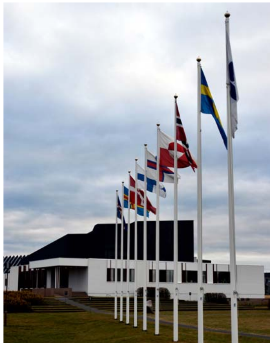
Norden hus i Reykjavik - Island

Kulturen og måske specielt litteraturen og sproget har potentiale til at yde sit eget selvstændige og kvalificerede bidrag til den globale klimaudfordring. Den globale klimaudfordring drejer sig grundlæggende om blandt andet erkendelse. En personlig erkendelse af klimaudfordringen. Her har litteraturen noget helt unikt at spille ind med. Hvis det skal gøres levende for os, så er det ikke nok med videnskab og journalistik - så skal kunstens og kulturens og i særlig grad litteraturens udtrykskraft på banen.