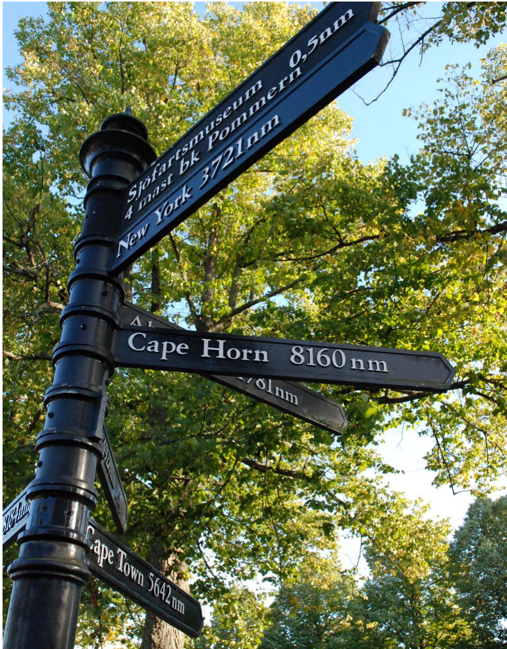
Skilt til resten af verden - Åland